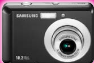
FOTO APARAT EC-ES15Z